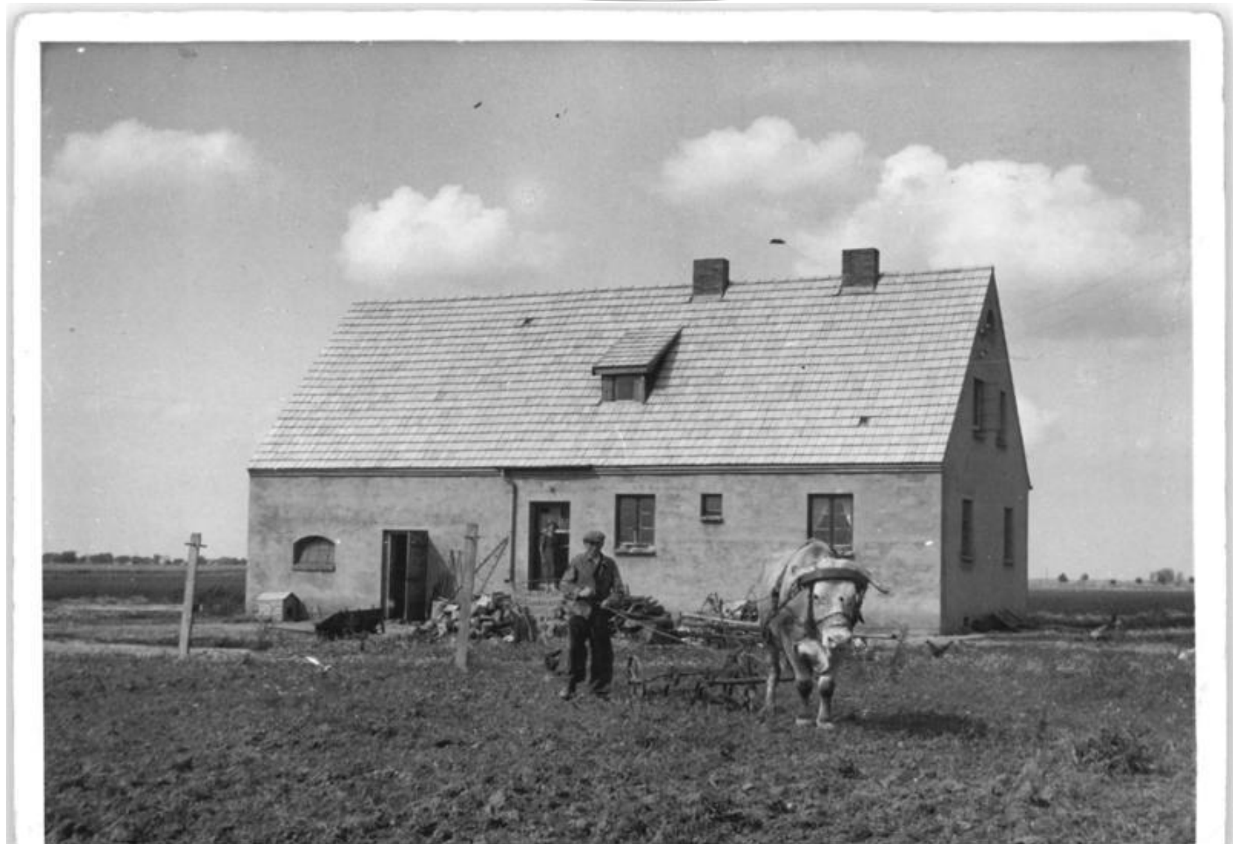
Bundesarchiv, Bild 183-R90795 Foto: Pietsch | 21. Juli 1950

Foto: BArch, Bild 183-R90795, Pietsch, 21.7.1950 (Wikicommons)