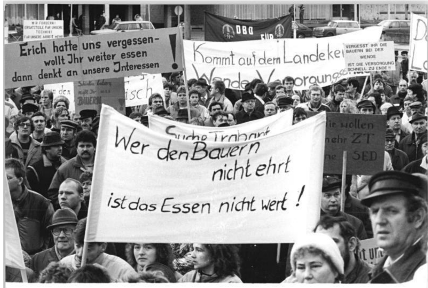
Januar 1990