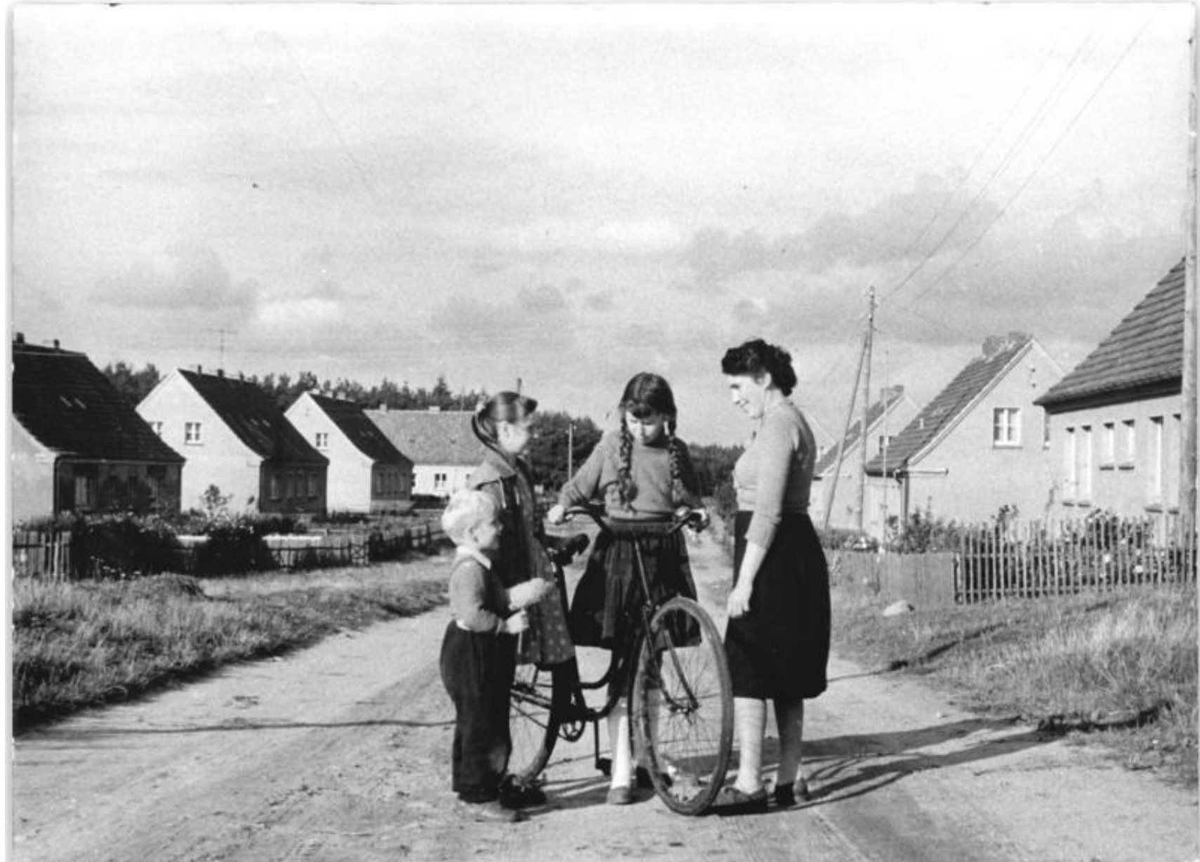
10. Oktober 1958