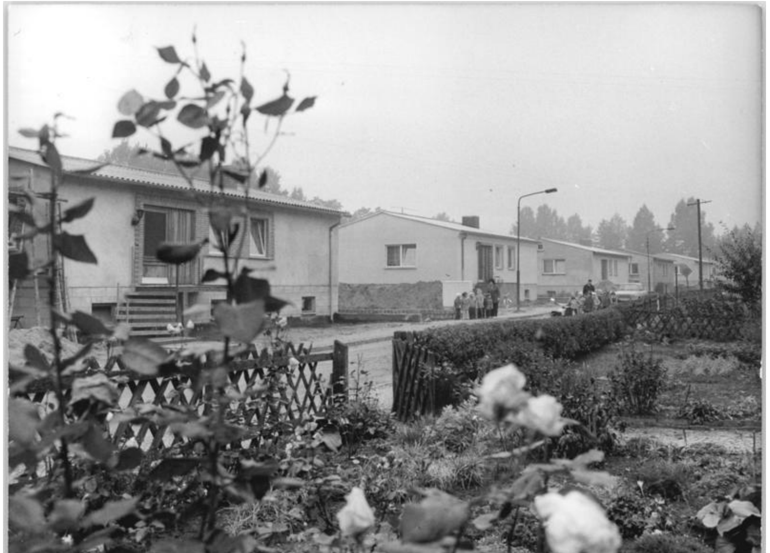
13. Oktober 1976