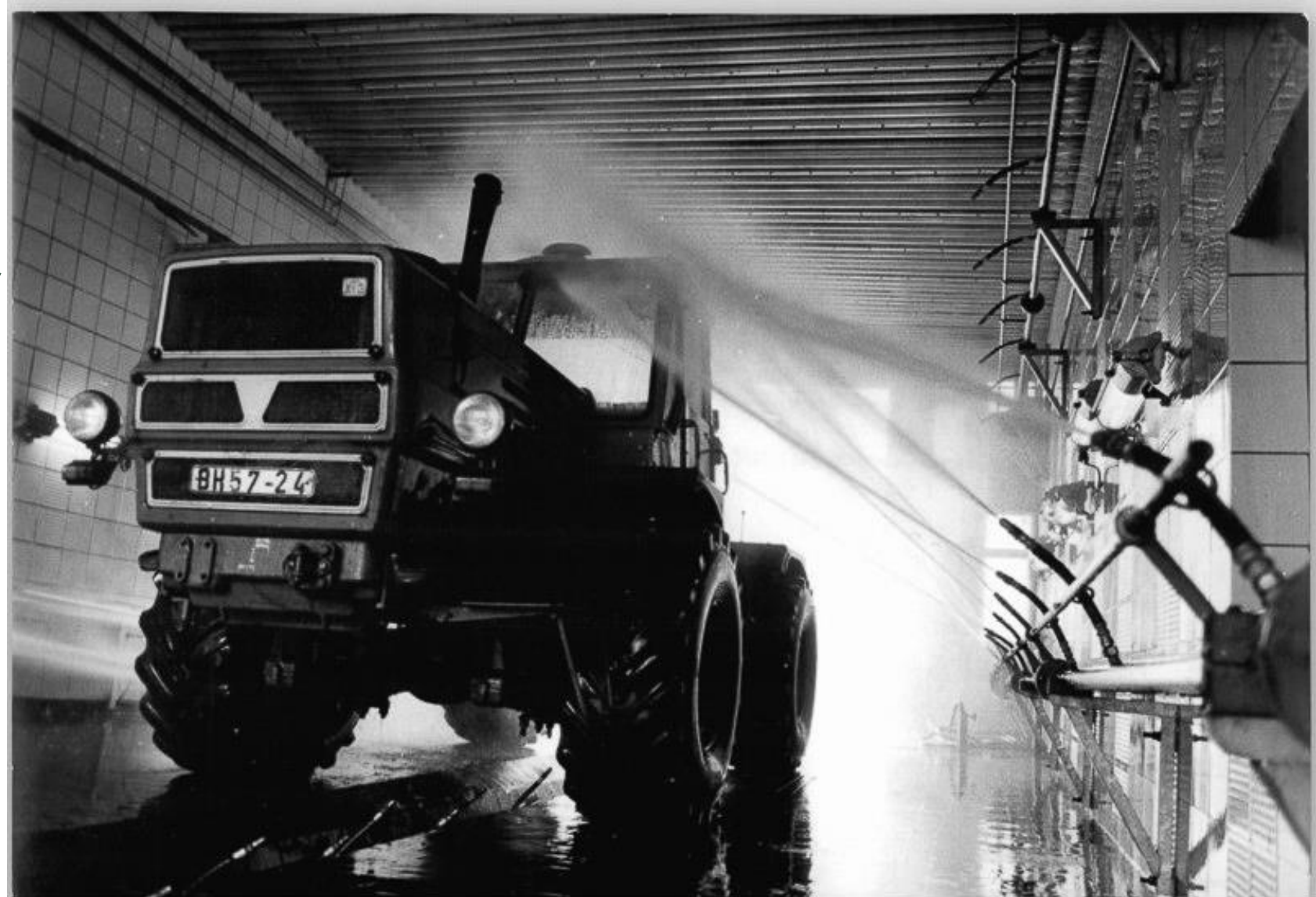
6. Oktober 1982

Foto: BArch, Bild 183-1982-1006-001, Wolfried Paetzold, 6.10.1982 (Wikicommons).