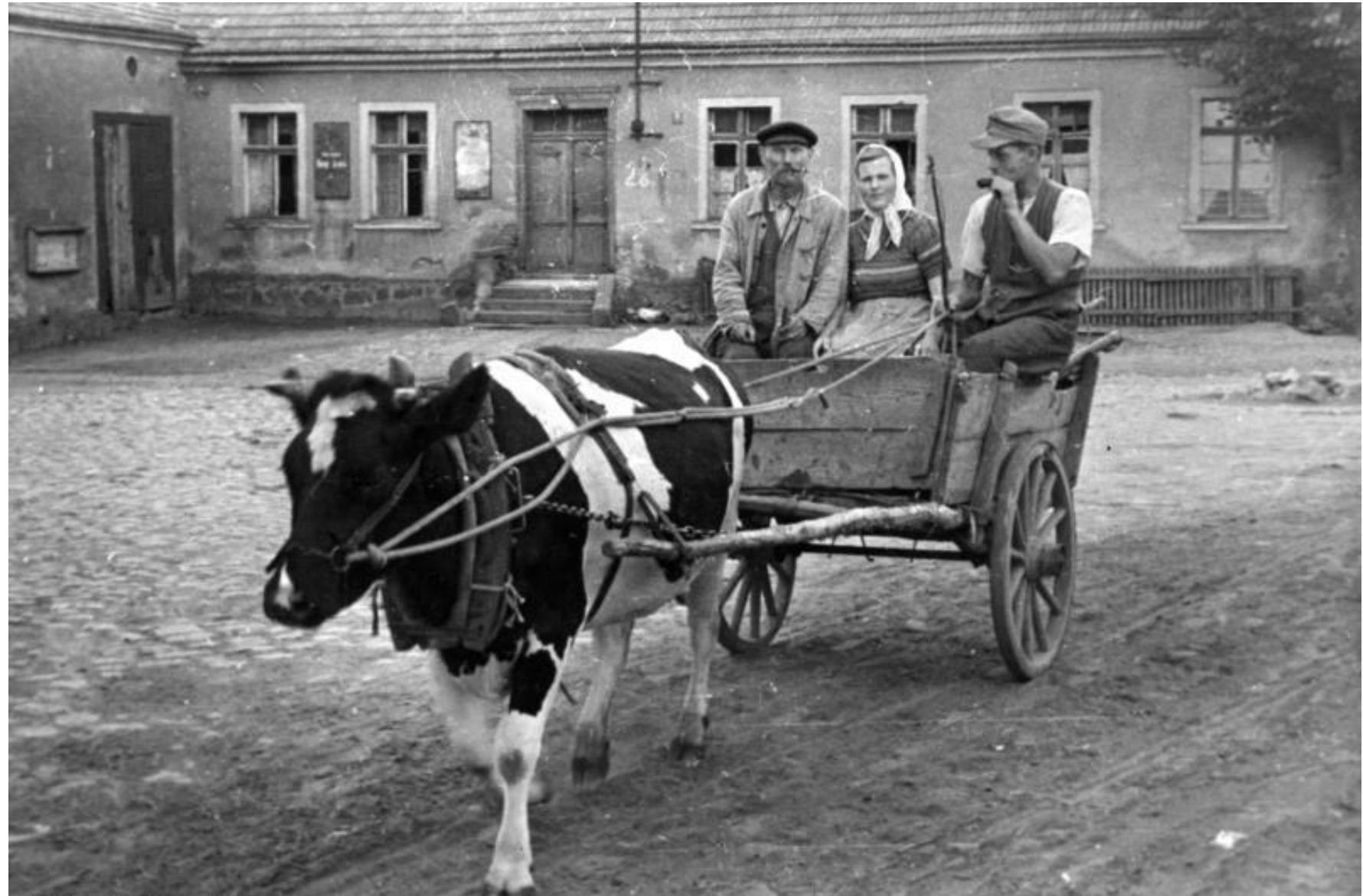
Bundesarchiv, Bild 183-R91954 Foto: Diedrich | 1948

Foto: BArch, Bild 183-R91954, Illus-Diedrich 1948, (Wikicommons)