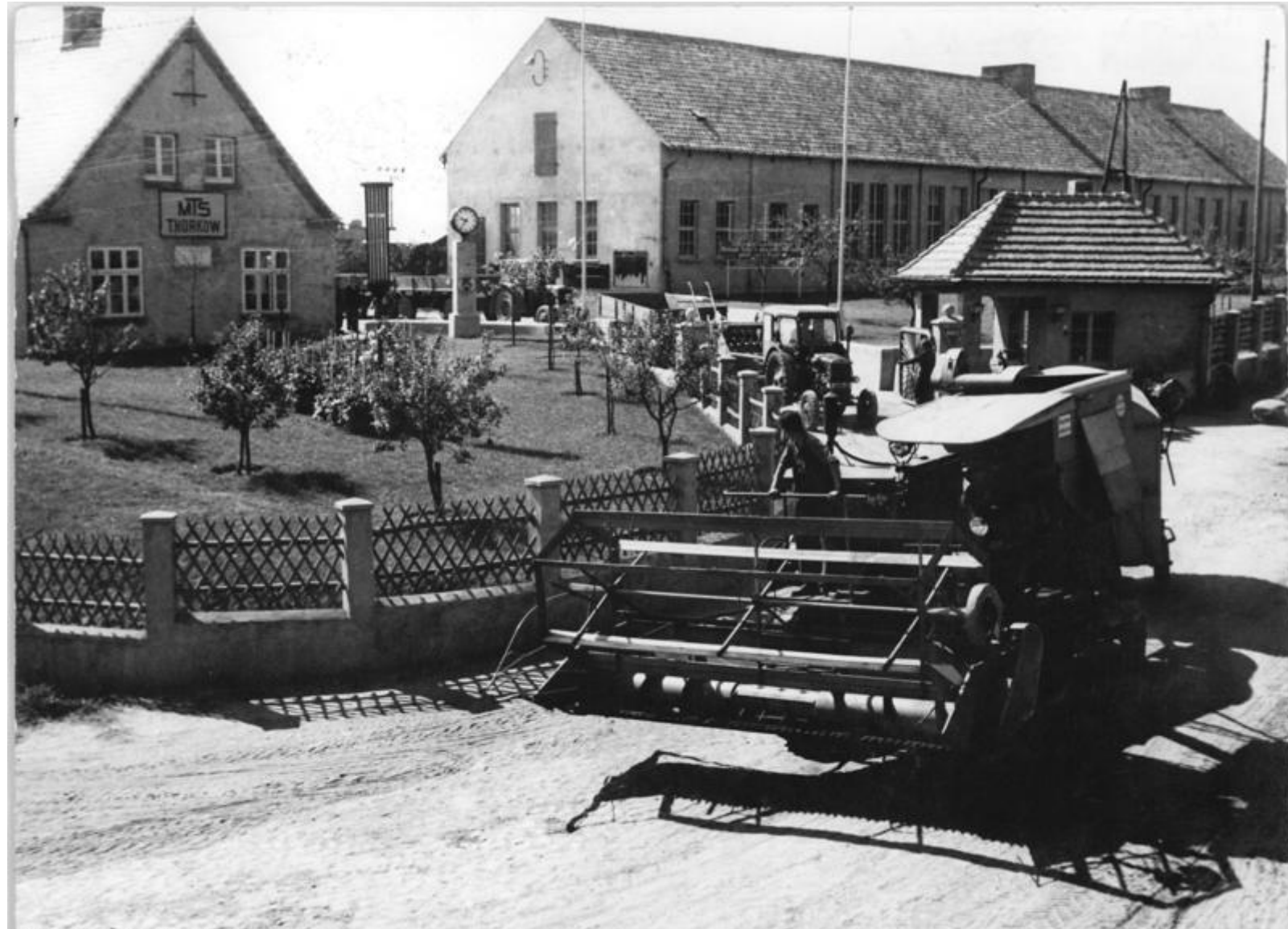
21. Juli 1956