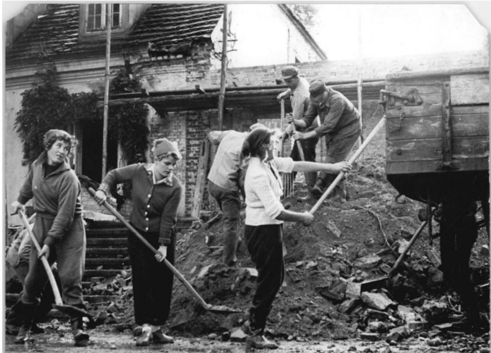
2. Oktober 1958