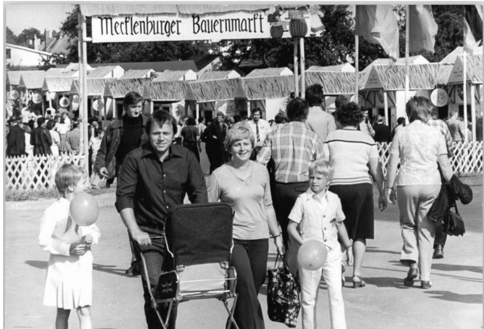
26. Juni 1982