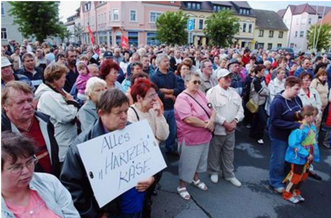
„Hartz-IV“-Demonstration Elsterwerda 2004