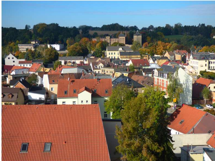
Stimmungslagen in Gößnitz (Thüringen)