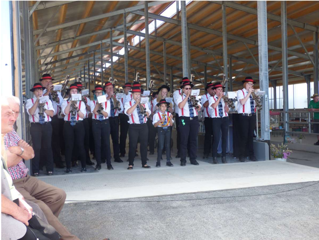
Schalmeienkapelle Thierbach, 2019