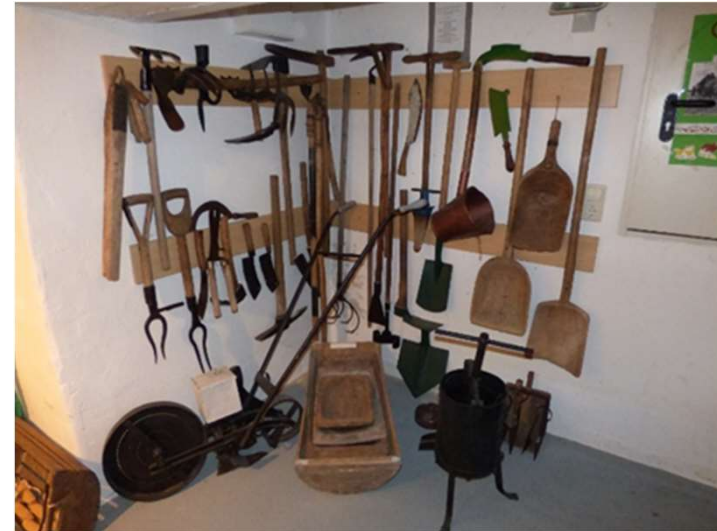
Heimatausstellungen in der Region Uecker-Randow (Mecklenburg-Vorpommern)