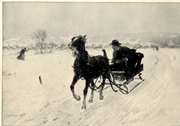
Der Karsarzt. Nach dem Gemälde von Hans Bachmann.